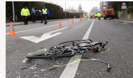
Die Verkehrsunfälle bei den Fahrradfahrern sind weiter auf hohem Niveau.