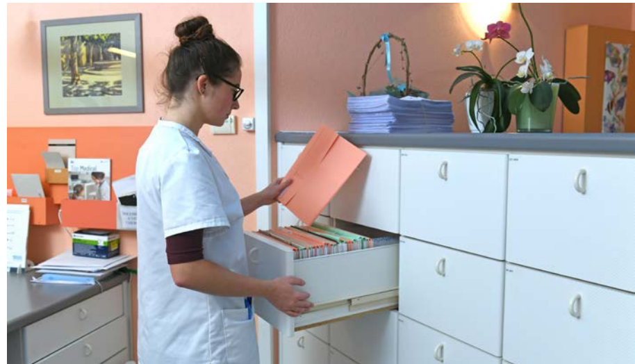
^ Von allen Patienten und Patientinnen wird ein Dossier mit der Krankengeschichte erstellt und nach jeder Konsultation nachgeführt.

«Ich möchte noch einige Jahre in meinem Beruf weiterarbeiten und mich